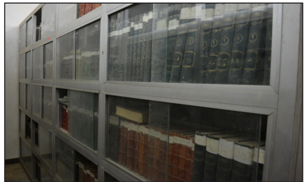
(صورة -٣) مكتبة غرفة تجارة كربلاء لعام ٢٠١٦م