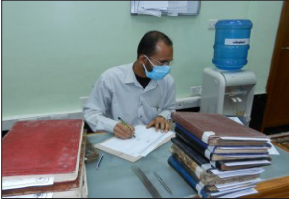
(صورة -٤) جانب من خدمات ترميم وصيانة المخطوطات في العتبة الحسينية المقدسة