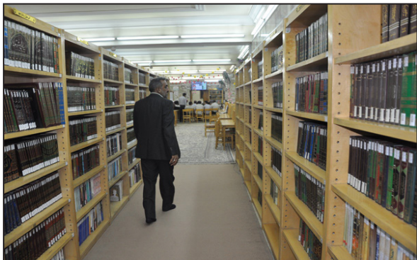
(صورة -٦) خزائن الكتب في مكتبة العتبة العباسية المقدسة