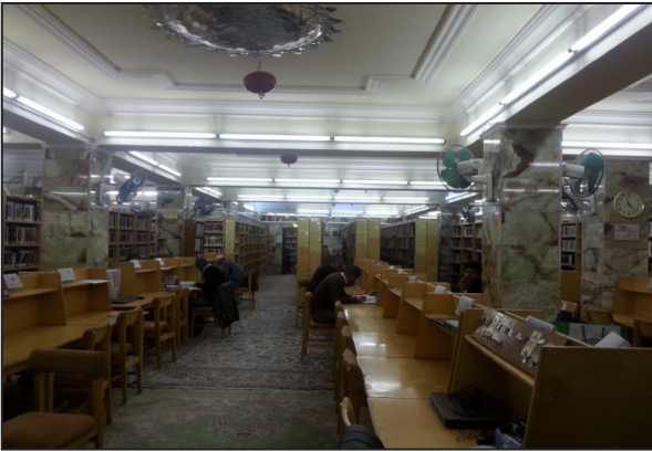
(صورة -٥) إحدى قاعات المطالعة في مكتبة العتبة الحسينية المقدسة لعام ٢٠١٦م