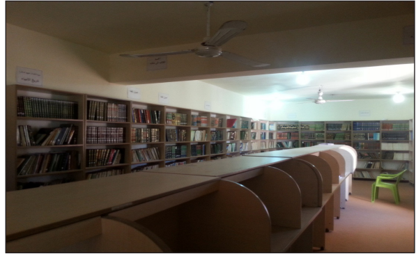
(صورة-٨) مكتبة حوزة الأمام القائم (ع) لعام ٢٠١٦م