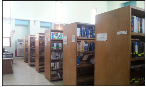
(صورة -١) خزائن الكتب في المكتبة المركزية العامة في مدينة كربلاء عام ٢٠١٦م