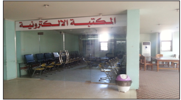
(صورة -٢) مشروع المكتبة الإلكترونية في المكتبة المركزية العامة في مدينة كربلاء لعام ٢٠١٦م