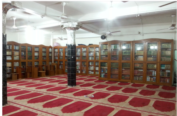
(صورة-٩) مكتبة جامع الأمام علي (ع) في مدينة كربلاء لعام ٢٠١٦م