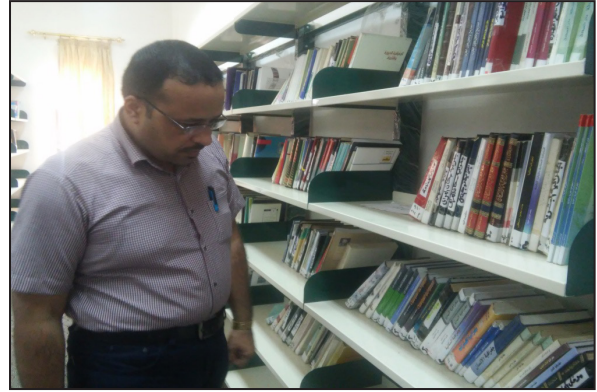
(صورة-٧) خزائن الكتب في المكتبة المركزية في جامعة كربلاء